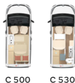
C 500 C 530

Angabe der Maximalwerte in dieser Baureihe.