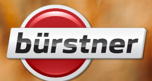
Abbildung beinhaltet Bürstner Individual Sonderausstattungen